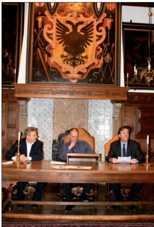
Tijdens de ondertekening in het Gemeentehuis te Naarden op 14 December 2010.

ring van de Basisregistratie Adressen en Gebouwen (BAG), de bijhouding van de toekomstige Grootchalige Basiskaart (BGT) en de huidige GBKN en de toetsing en het beheer van waterkeringen en rampenbestrijding.